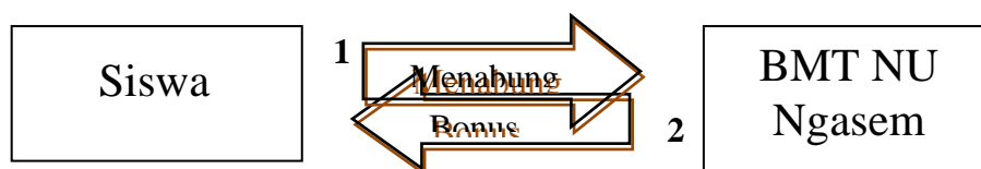
Skema Simpanan “Si Galis” Praktik Pertama